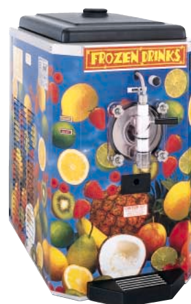
オプションの装飾パネル装着時