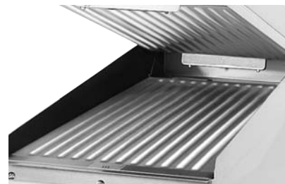
オプションのグループつきフラット、及びアップープラテン