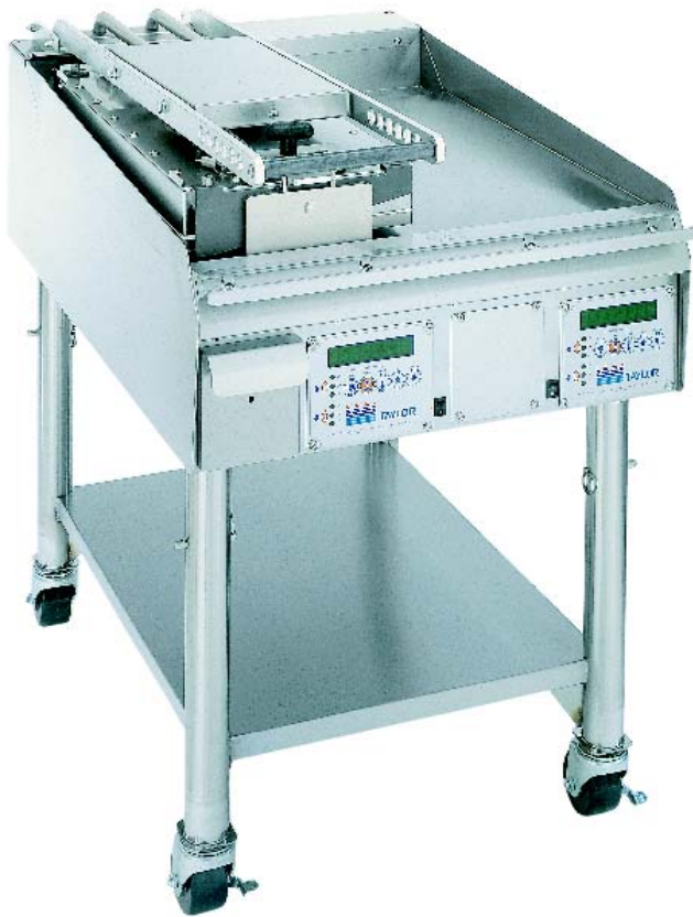
オプションのカート装着時