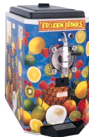
オプションの装飾パネル装着時